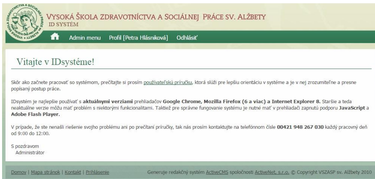
Obr. č. 3 – Úvodná obrazovka